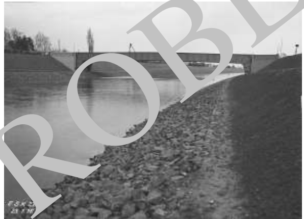
Zweigelenbrücke bei Kanalkilometer 15,627 - die Aufnahme wurde am 21. Januar 1936 aufgenommen.